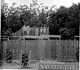
המפגש בדרך העץ

מכון וי שיעור של ספ מאות ז בכל זה הרפני משפחו ריקור, הגילא ספורט שישה בדרגו מתחם משפד משפד וחבלי דוקיב מתחג אתג שליח חץ וי כרחב מתחו לילד הליכ לקטו וסדנ ויש חוויו מחש בנוכ ב"א וינג התו תזכ המנ לרז מתי באו איפ עלו כרז פרו g.il