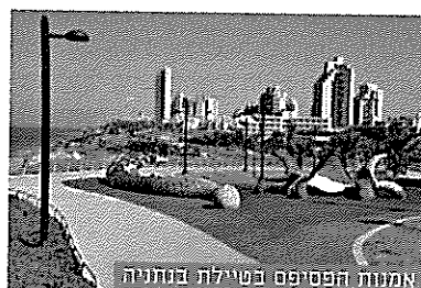
אמנות הפסיפס בטיילת בנתניה

מתי: 16:18 באוקטובר, חוה"מ סוכות איפה: כיכר העצמאות, נתניה